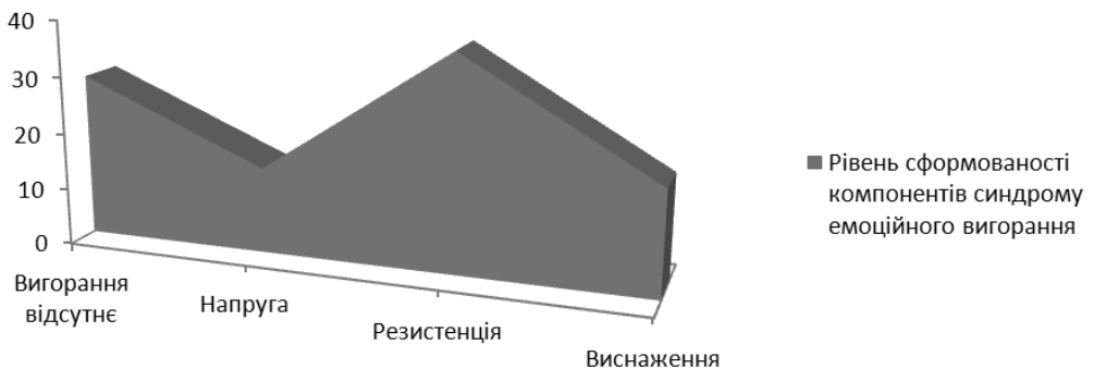
Рис 1. Рівень формування компонентів синдрому емоційного вигорання вчителів старших класів