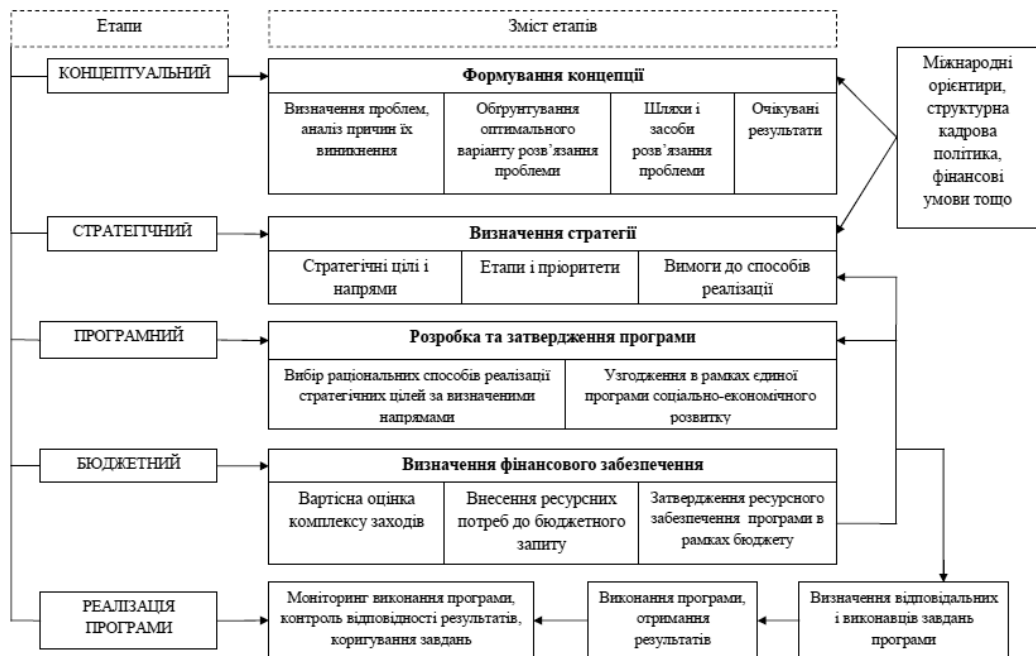
Рис. 1. Формування та реалізація державної земельної політики

ду кількісних показників становлення інституту прав власності на землю як фундаментального базису еволюції ринкових процесів у сфері земельних відносин в Україні відбулося. Але поглиблений предметний аналіз стану земельного фонду країни, сформованої структури правовідносин на землю і динаміки їх трансформації, організації та принципів функціонування системи державного управління земельними ресурсами загострює низку глобальних проблем, які потребують нагального вирішення.